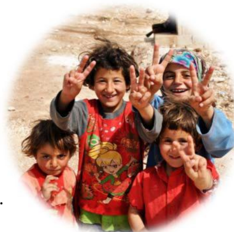
camp Atmeh, en Syrie, 2013

Il est tout à fait normal d'avoir des attentes... On pourrait même dire qu'on s'y « attend »! Lorsque vous parrainez des réfugiés, vous pourriez avoir des attentes sur le comportement des personnes parrainées et sur le type de relation que vous formerez avec elles. Les réfugiés parrainés pourraient également avoir des attentes sur votre groupe de parrainage ou sur la vie au Canada. Lorsque ces attentes ne sont pas réalistes, elles peuvent mener à des malentendus ou à des conflits interpersonnels, voire même, dans des cas graves, à une rupture de l'engagement de parrainage.